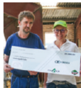
Vindere af ØkoKalvekampen 2015/16 fra team Vækstjysk Kalv. Præmien var 20.000 kroner til en kalvefaglig studietur.

AF FINN STRUDSHOLM OG CAMILLA KRÄMER, SEGES ØKOLOGI